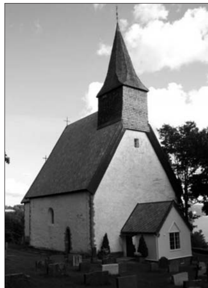
Byneset kirke som er over 800 år