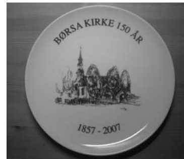
I salg på kirkekontoret. 150 kroner per stk. 250 kroner for et sett.

til høsten/ tidlig vinter. På menighetens årsmøte den 4. mars etter gudstjenesten vil menigheten få en orientering om arbeidet, å ha mulighet til å komme med innspill.