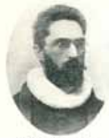
Ole Nilsen Brøder 1913—1920