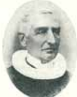
Peter Olavsson Døge 1870—1878