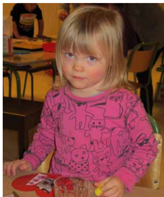
FRUKTNØTT (Finner du alle fruktene?)