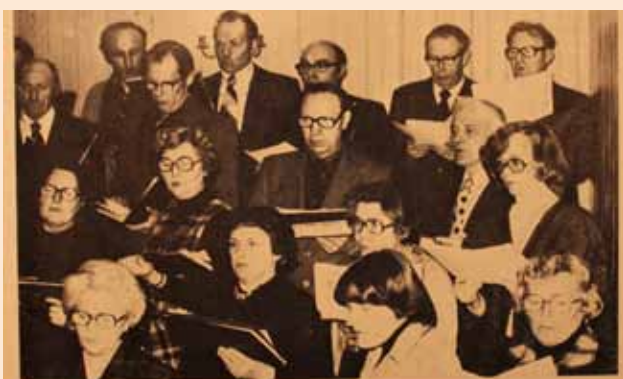
DU HAR VEL LYST TIL Å BLI MED I MENIGHETSKORET! - Der trengs flere nye sangere. Øvelsene er lagt til tirsdag kl. 20-22. Korledelsen ønsker gamle og nye sangere velkommen til ny start nå i september. Møtested: Børsa kirke.

Og i nr 5/78 var det eit bilete av koret, men ikkje av dirigenten.