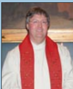
Presteordinasjon - side 5 -