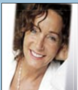
Celebert besøk - side 7 -