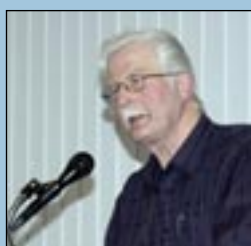
Kulturkveld - side 6 -