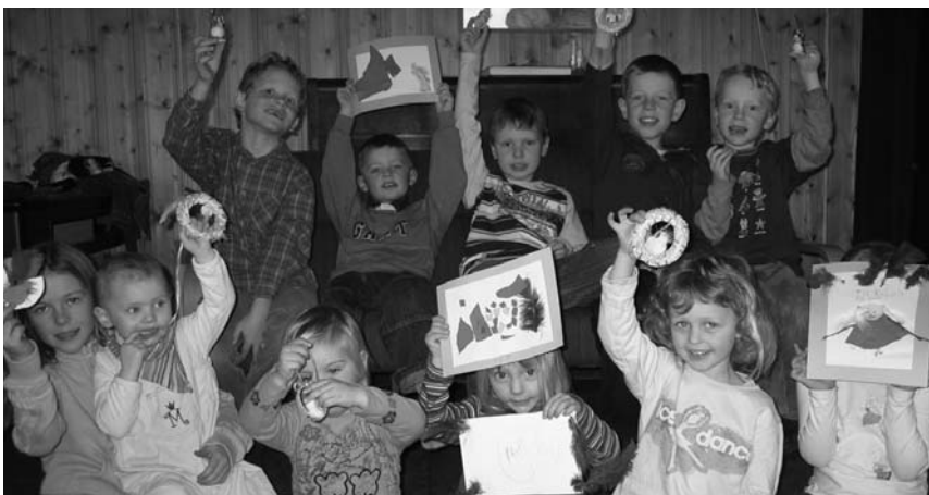
Stolte barn viser fram det de har laget

På formiddagen søndag 25. mars var det full aktivitet i bedehuskjelleren i Børsa. Søndagsskolen hadde påskeverksted, og både små og store koste seg med å lage påskepynt. Kyllinger og påskebilder i mange varianter ble produsert av ivrige barnehender.