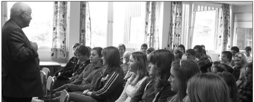
Ved Skaun ungdomsskole hadde elevene forberedt spørsmål til biskopen om alt fra alkohol til gudstro.