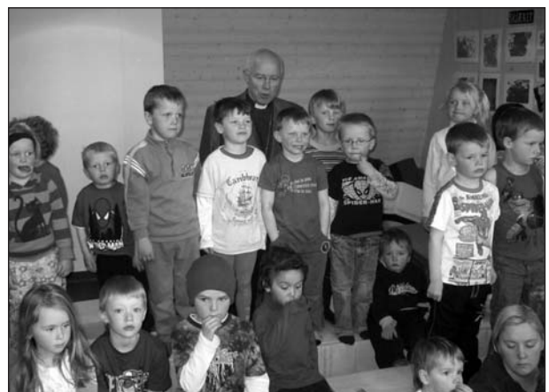
Barna i Oterhaugen barnehage i Buvika syntes det var stas å få besøk av "sjefspresten".