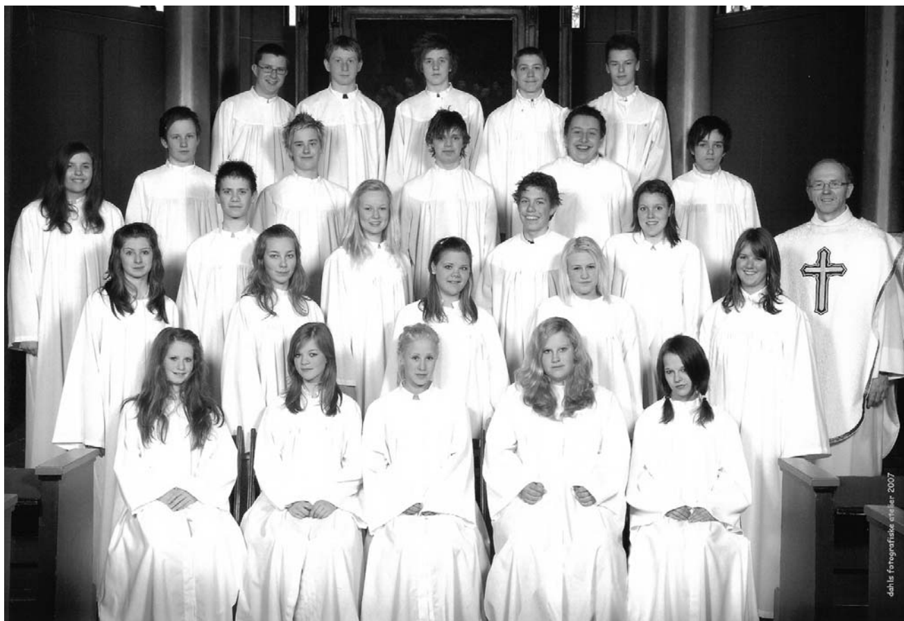
dahlis fotografiske atelier 2007